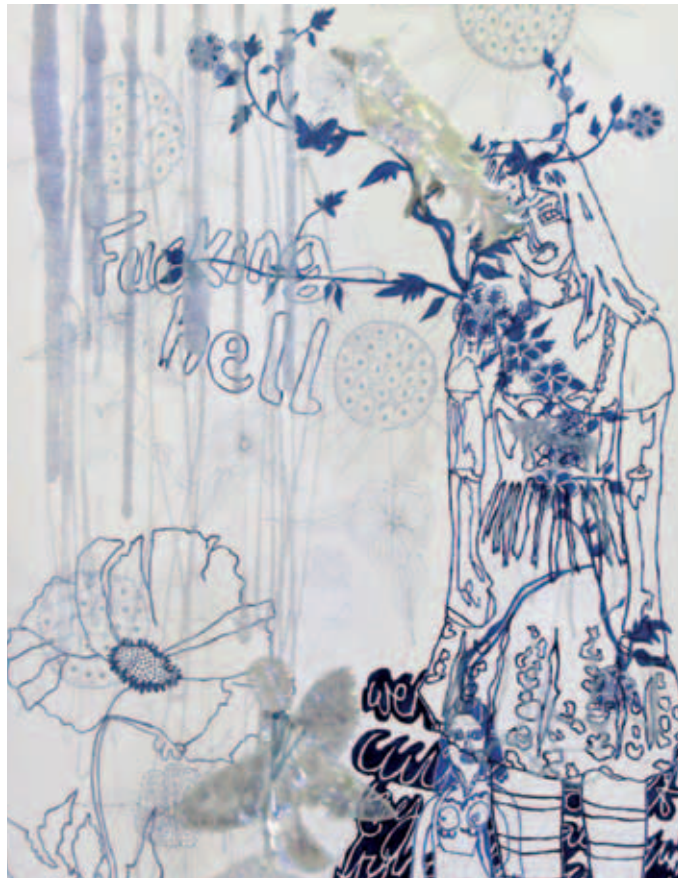
Delaine Le Bas, „There's Birds in The Bushes and Ears and Eyes in the Sky," 2002, Courtesy: Galleria Sonia Rosso und Galerie Giti Nourbakhsh / Delaine Le Bas (Foto: Tara Darby)