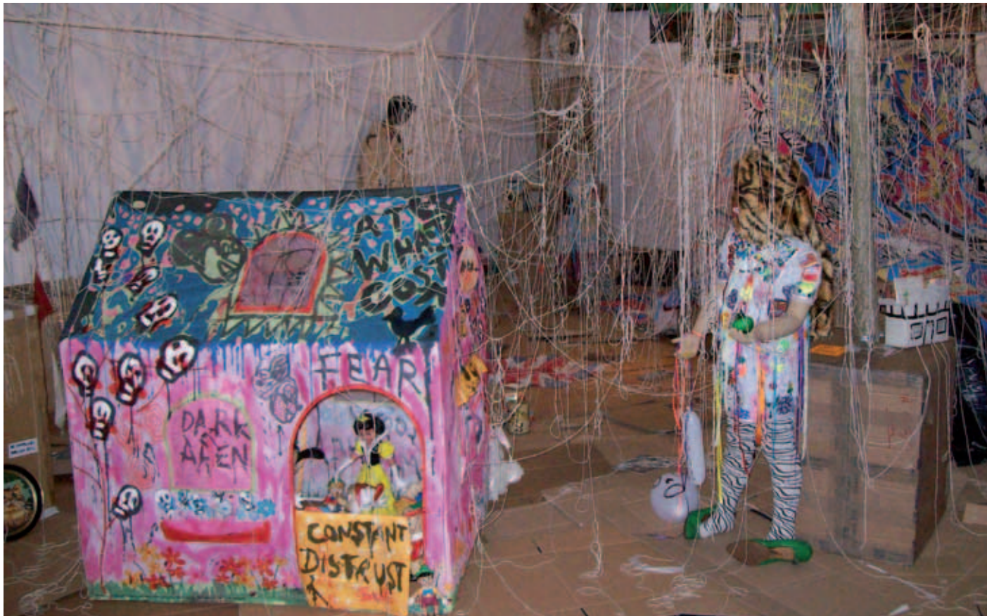
Delaine Le Bas, „Neighbours Making Evil“, 2007, Rauminstallation, OK Zentrum für Gegenwartskunst, Linz (Foto: Delaine Le Bas) Delaine Le Bas, „Meet Your Neighbours“, 2007, Courtesy: Galleria Sonia Rosso und Galerie Giti Nourbakhsh