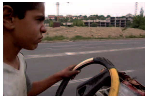
„Pretty Dyana“, Regie: Boris Mitić, 2003

Um Anmeldung wird gebeten (begrenzte Platzzahl!)