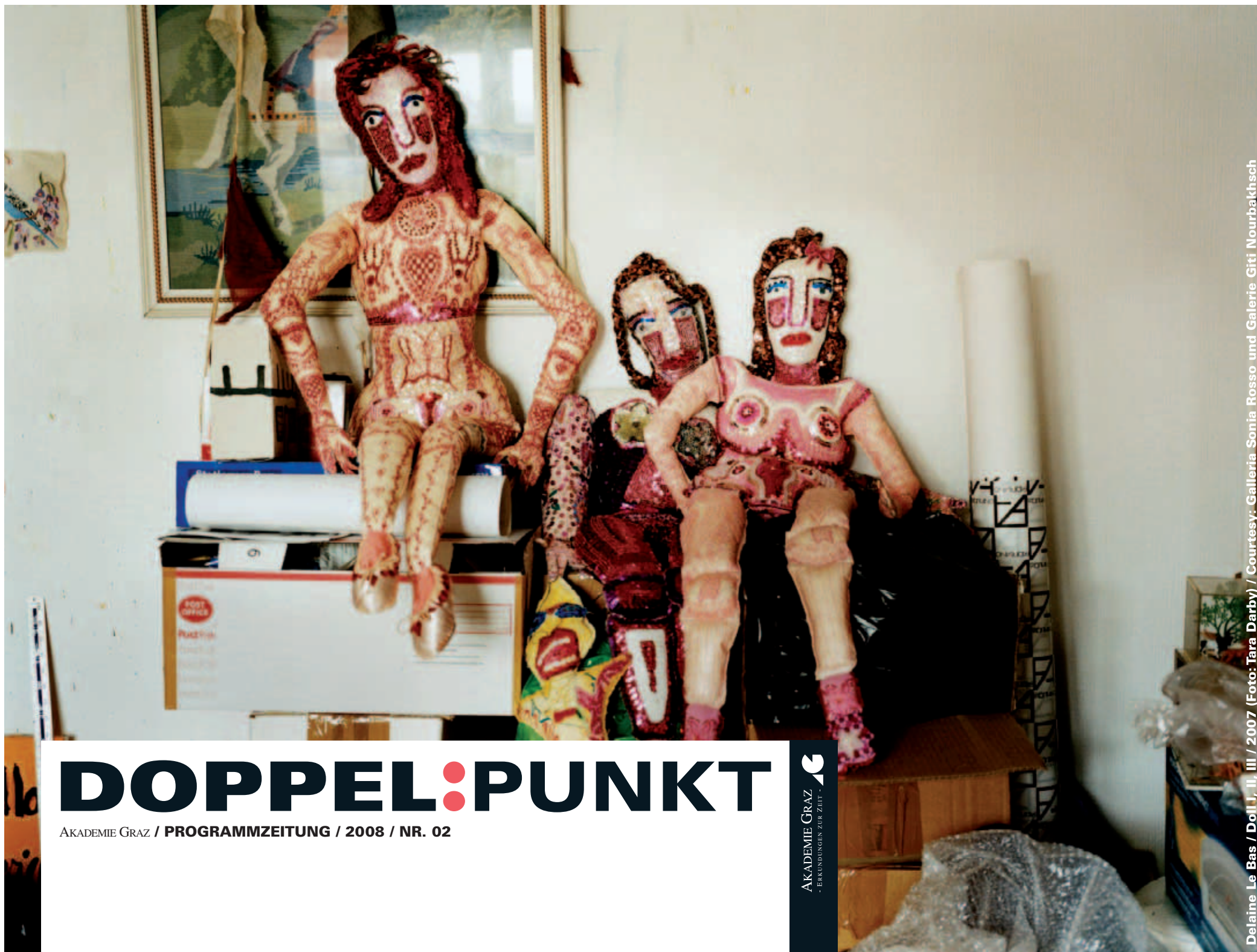
Delaine Le Bas / Doll I, II, III / 2007