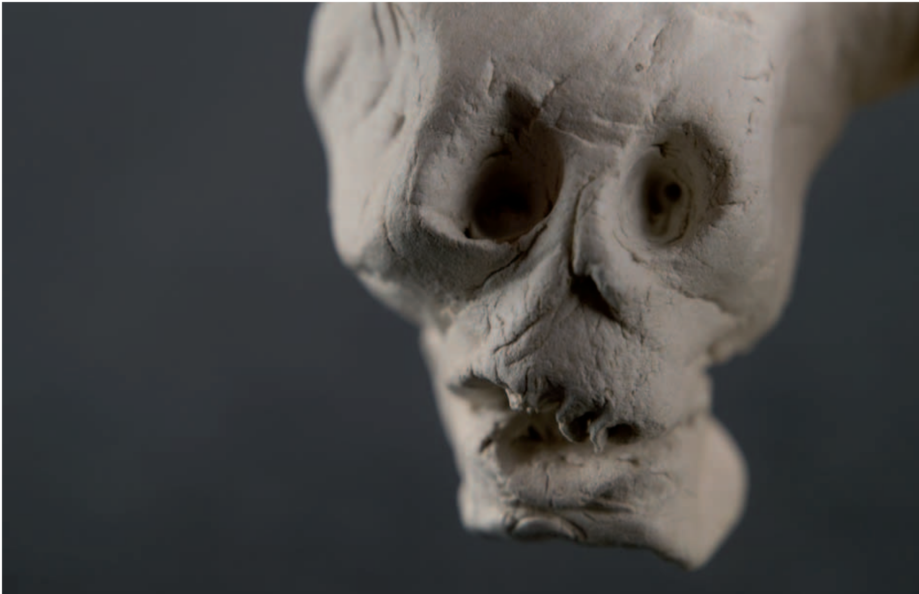
Petra Sterry, Hew-Man & Sofia (# 5) , © Petra Sterry, VBK Wien 2008

KULTUR MACHT MENSCH www.kultur-macht-mensch.at