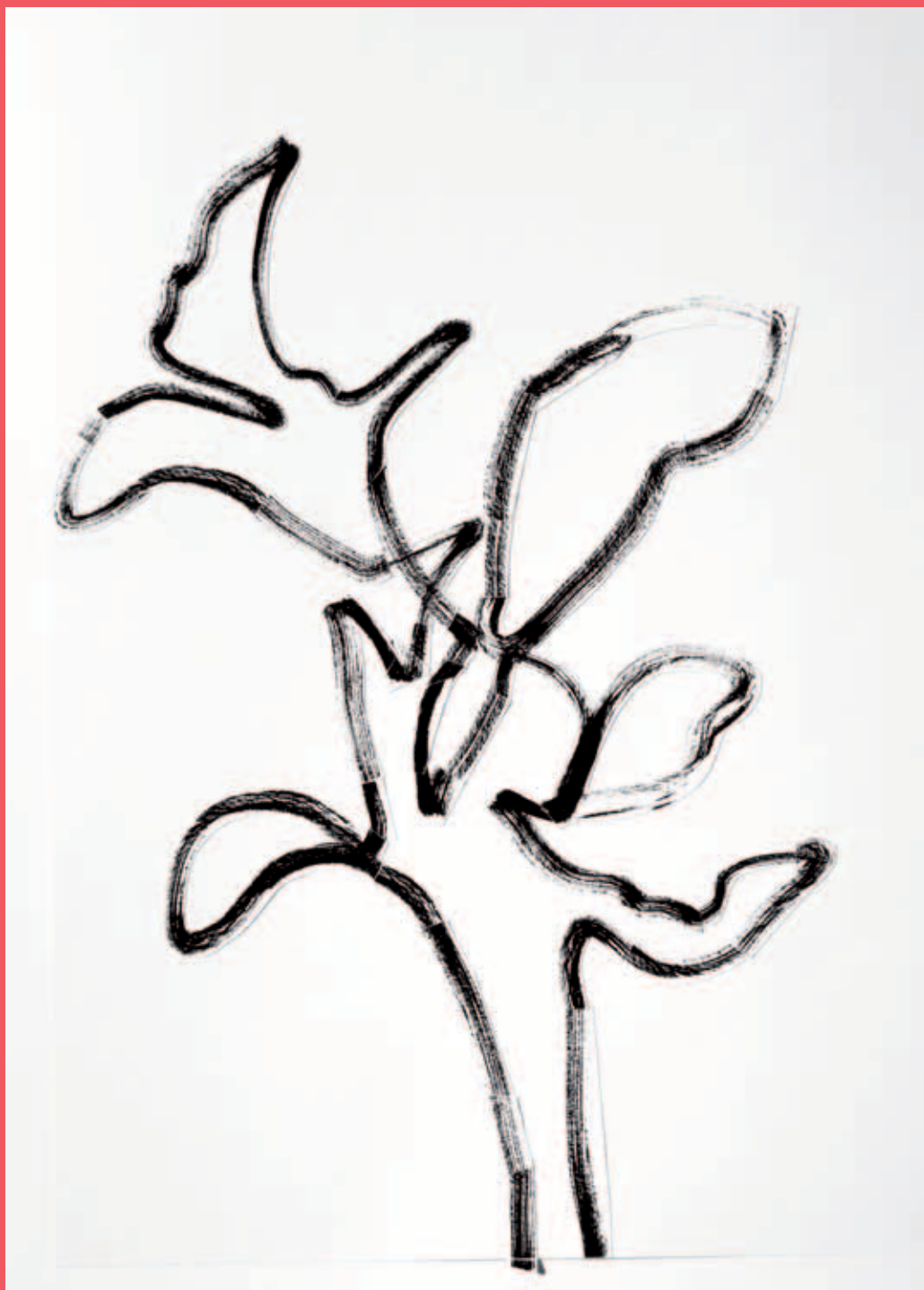
Lisa Pock / O.T. / 2007 / Wandarbeit (Collage, Kopien)

Auch die Zeichnungen sind auf das Essentielle reduziert. Als zeitlose Motive dienen Pflanzen, die in fragilen Strichzeichnungen abstrahiert sind. Die Loslösung der Linien(zeichnung) vom Papier und die Möglichkeiten eines Transfers in den dreidimensionalen Raum sind Ideen, mit denen ich mich derzeit auseinandersetze. Die Verlagerung der Perspektive führt zur Destabilisierung des Vertrauten und stellt in beiden Werkgruppen ein zentrales Element dar.“ (Lisa Pock)